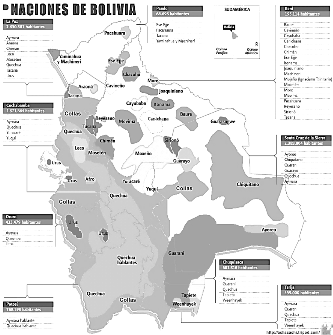
Gráfico 1. Mapa de ubicación de las naciones indígenas de Bolivia.

Los Urus. Su trascendencia siempre fue muy escasa a raíz del dominio expansivo aymara que perduró durante todo el tiempo de la Colonia, las costumbres y pureza se mantienen casi intactas, más allá de la escasa densidad poblacional.