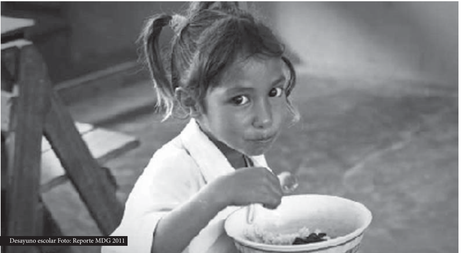
Desayuno escolar